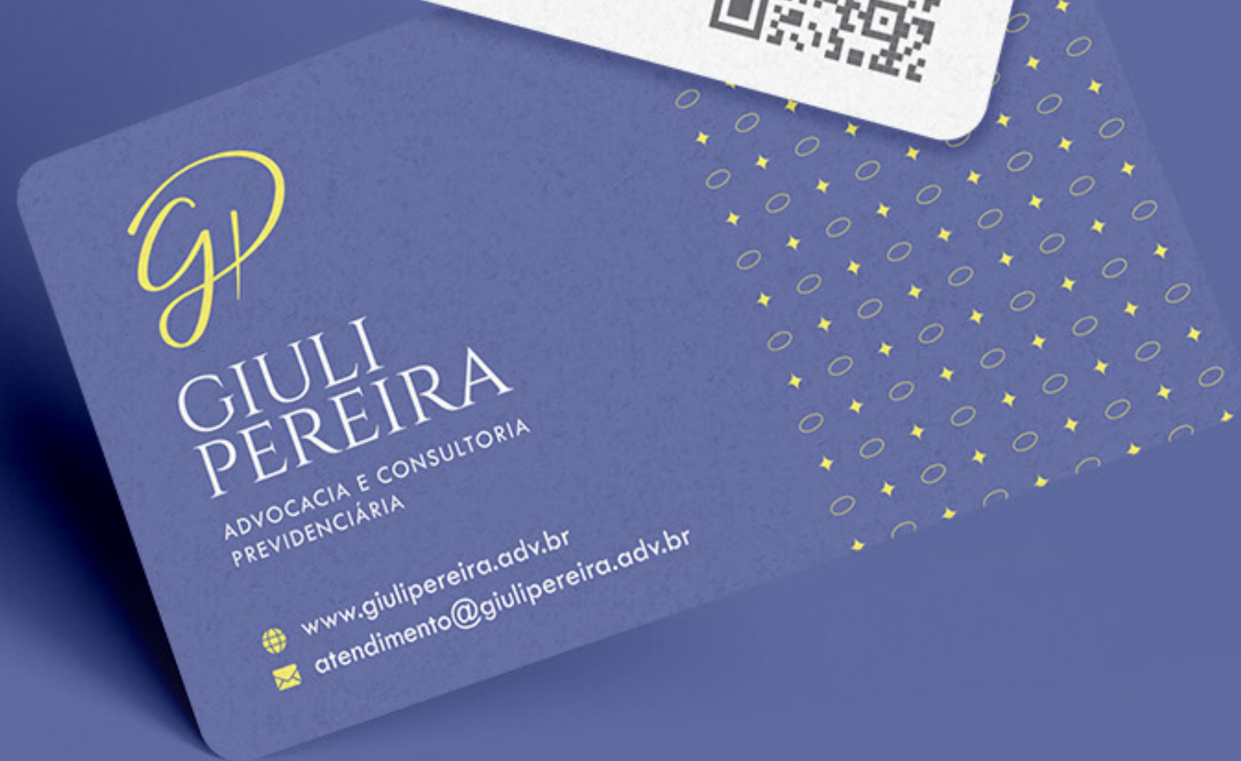
Cartão de Visita